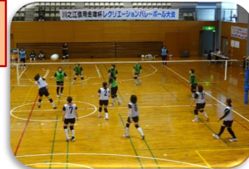
第19回川之江信用金庫杯レクリエーションバレーボール大会

今年の夏は蒸し暑い日が続きましたが、皆様いかがお過ごしでしょうか？ 当庫では、地域のみなさまのご協力のもと、少年野球大会を開催し、また、紙おどりに参加いたしました。スポーツや祭りと熱いイベント模様をご覧ください♪