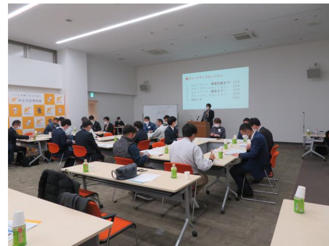
▲講演会後のディスカッションの様子