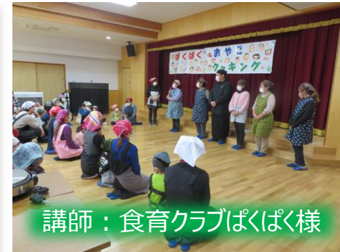
講師：食育クラブぱくぱく様