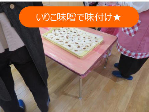
いりこ味噌で味付け★