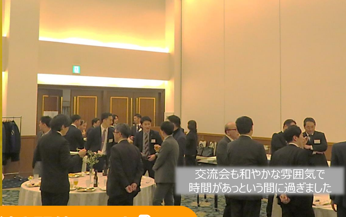
交流会も和やかな雰囲気 時間があっという間に過ぎました